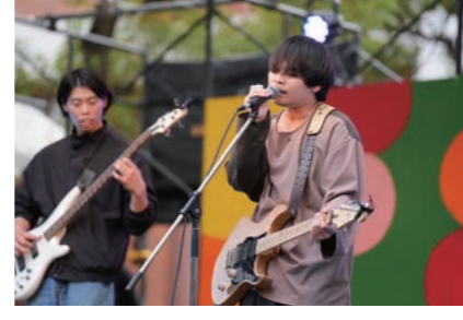
第59回 阪駒祭のテーマは Let's cheer up ～無限大の盛り上がり～