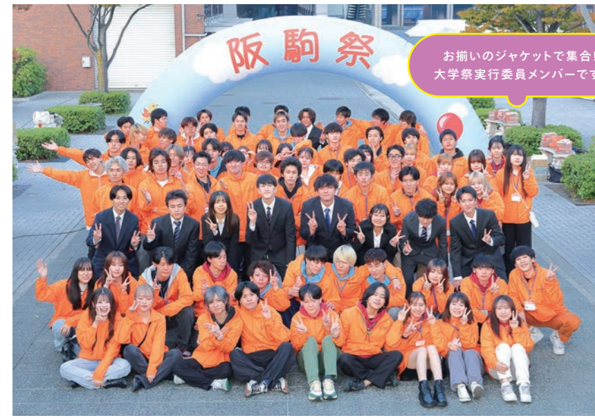
お揃いのジャケットで集合！ 大学祭実行委員会メンバーです！

する私たちはもちろん、参加する学生たちや教職員も意欲満々。産業に関わる大学らしく、地元の企業にもたくさん協賛していただき楽しく盛大に2日間のプログラムを繰り広げます。