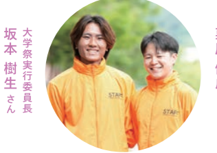
SCHOOL FESTIVAL EXECUTIVE COMMITTEE