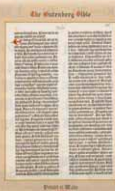
グーテンベルグ42行聖書零葉

今後もコレクション展を予定しています。一人でも多くの方の鑑賞をお待ちしております。