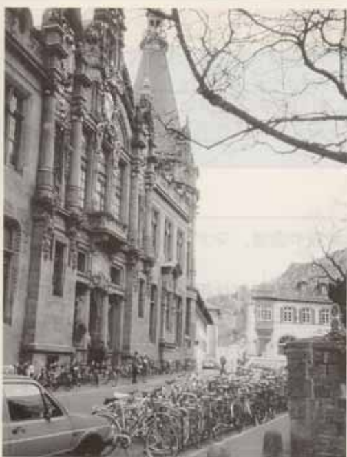
●ハイデルベルク大学図書館正面

もう4年前のことになるが、館長就任後ほどなく、ドイツのライプチヒ商工会議所から私宛に通の手紙が届いた。1989年秋ベルリンの壁が崩壊しドイツの再統合が成るや否や、その商工会議所は直ちに再建に立ち上がる。第2次大戦までは「ドイツ国内でも最も重要な経済学・社会学関係の図書館として」知られていたにも拘わらず、40年間に及ぶ東ドイツ政権の時代に資本主義時代の資料は不要と言わんばかりに8万冊もの貴重な歴史的文献が西ドイツのみならず世界中に売りさばかれたと言う。そしてその一部4千7百冊ほどは本学図書館のものとなっているのである。その扱いはどうなっているか、という問い合わせであった。