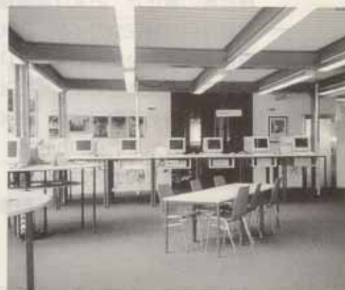
●図書館内部情報検索室

「電子化・情報化が進めば、それだけ情報の発信源となる、他に無い独自の文献が益々必要ですね」と言えば、「ヤ、ナチュールヒヒ！当然です！」と応えた。1401年に創立されたドイツ最初の大学、ハイデルベルク大学の図書館も、外見の古風さを残しつつ、想像以上に内部は電子化・情報化していた。しかしそうであればあるほど、優れた文献の確保が欠かせないという事態の認識こそ、情報化の時代に即して大学と図書館に求められる見識であろう。ライプチヒ商工会議所図書館の努力は、それを物語って余りあるものであった。