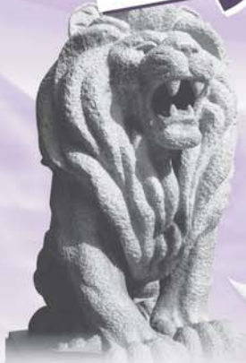
難波橋のライオンが僕らのモデルです

今年に学園創立から80年です。80年前の学園と当時の大阪について知識を深めてみませんか。